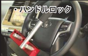
・ハンドルロック