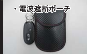
・電波遮断ポーチ