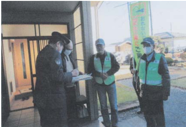
(12月13日) ひたちなか警察署

☆ 空き巣など住宅侵入窃盗の被害防止対策 年末の犯罪抑止活動の一環として、ひたちなか警察署、下妻警察署、鹿嶋警察署において、警察職員と、警察本部長、防犯ボランティア、防犯協会等が連携した合同住宅防犯診断を行いました。 参加者が複数の班に分かれて各家庭を訪問し、警察官が家人等に対して、窓ガラスやドア、屋外の防犯対策などを確認し、参加者が、防犯チャリン等を配布しながら、「鍵かけの徹底」や「窓ガラスの強化」など複数の防犯対策を呼びかけました。