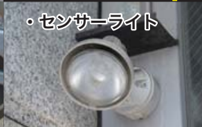
・センサーライト