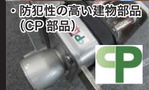
・防犯性の高い建物部品 (CP部品)